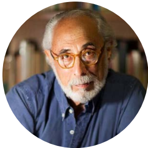
Santiago Kovadloff Filósofo, ensayista y poeta